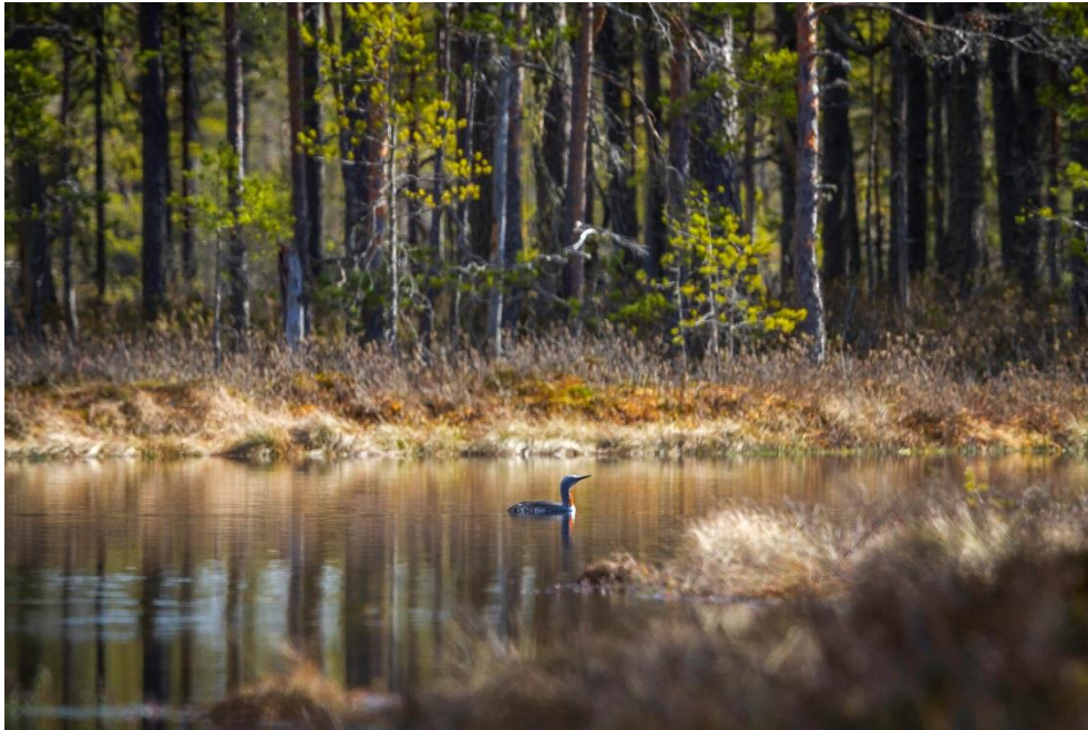
Smålom, Knuthöjdsmossen 2014.

Länsstyrelsen i Örebro län har bidragit med medel för reseersättningar i samband med fältarbetet.